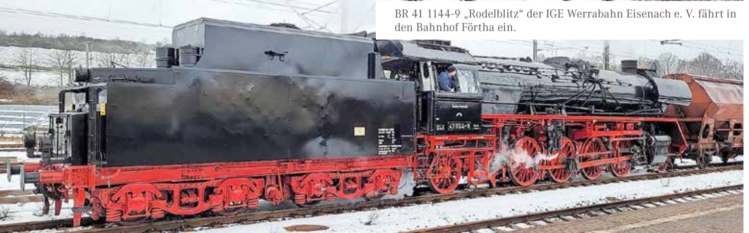
BR 41 1144-9 „Rodelblitz“ der IGE Werrabahn Eisenach e. V. im Bahnhof Gerstungen.