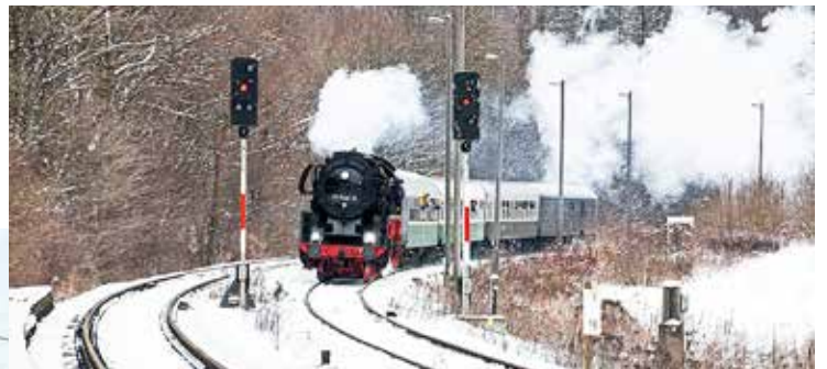
BR 41 1144-9 „Rodelblitz“ der IGE Werrabahn Eisenach e. V. fährt in den Bahnhof Förtha ein.

Eine andere Hundertjährige hatte am 22. Januar außerdem eine Ausfahrt von Bebra nach Gerstungen. Kollegen der Gemeindewerke Gerstungen sorgten dafür, dass die Lok aus Ulm ausreichend mit Wasser versorgt wurde.