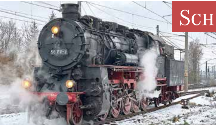
BR 58 1111-2 der UEF (ULMER EISENBAHN FREUNDE) am Gerstunger Bahnhof.

Jahrgang 31 | NUMMER 3 | Freitag, den 10. Februar 2023