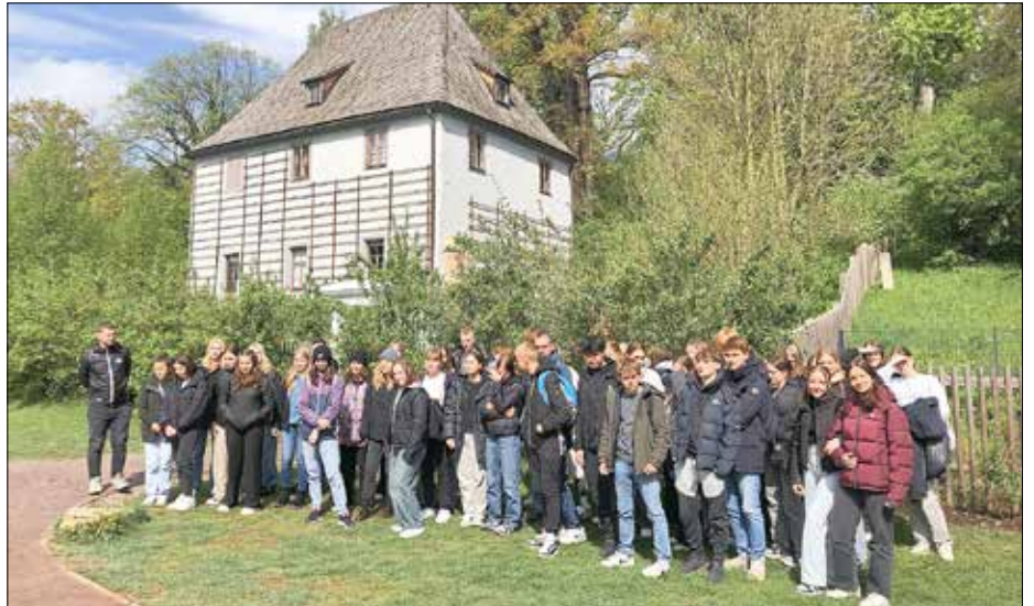
Vor Gothes Gartenhaus in Weimar: Schüleraustausch Gerstungen - Breda im April 2024