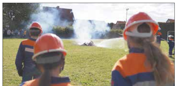
Die Jugendfeuerwehr Marksuhl löscht einen Brand auf dem Schulhof im Rahmen einer Vorführung.