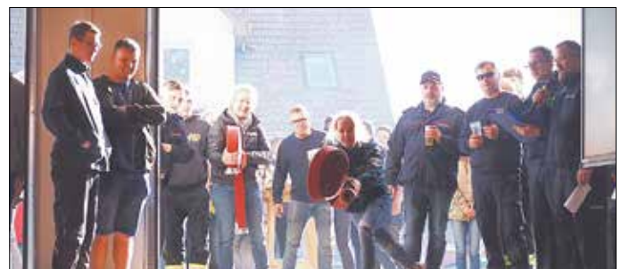
Bei den Vereinswettkämpfen (Feuerwehrspielen) kam es neben Kondition und Fachwissen, auch auf Geschicklichkeit an. Die Mannschaft der Freiwilligen Feuerwehr Förtha sicherte sich hierbei den ersten Platz und trug den Gewinn, ein Fass Bier, nach Hause.